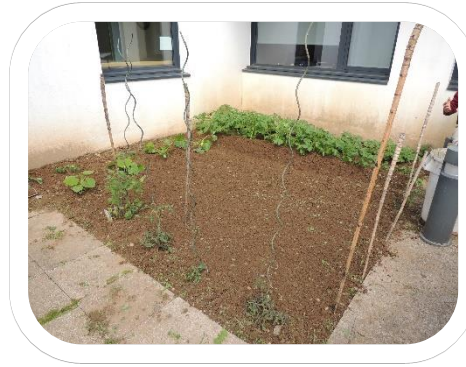
3 juillet, ça pousse!