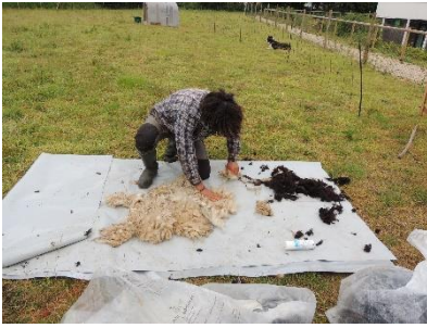
Tonte de Paloma et Plume

La première opération pour l'obtention de la laine est bien sûr la tonte qui s'effectue au printemps. L'outil le plus traditionnel était les forces , déjà utilisées par les Gaulois. De puissants ciseaux qui seront remplacées par les tondeuses, manuelles, puis électriques.