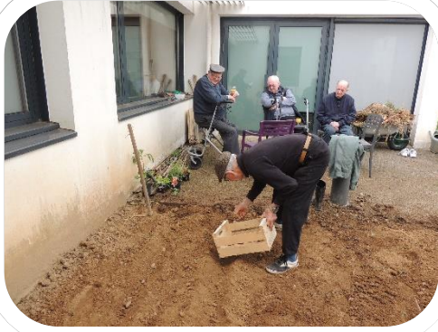
05 juin, 1ères plantations

Début juin, l'atelier jardinage a enfin redémarré. Nos jardiniers se sont remis avec enthousiasme à la tâche.