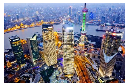
SHANGHAI et ses gratte-ciels

Officiellement, l'ensemble des sections de la Grande Muraille construites à travers toute l'histoire de la Chine se déploie sur une longueur de 21.196 km . De nos jours, ne subsistent que quelques centaines de kilomètres de mur que les visiteurs peuvent admirer.