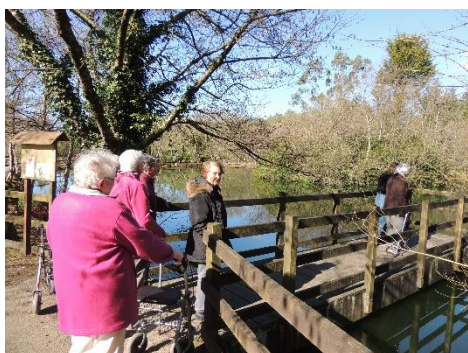
Sortie au parc des Pâquerettes à Dirinon, un petit air de printemps, pour le plus grand bien de tous.