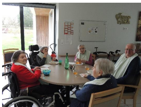
La chandeleur, crêpes et cidre : une évidence pour les bretons