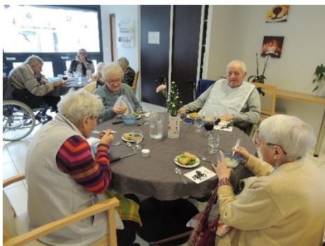
Nouvel An Chinois, repas traditionnel très apprécié.