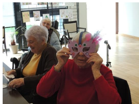
Un variant du masque... Tellement plus sympa!