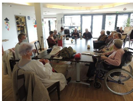
Les tricoteuses sont enfin de retour.