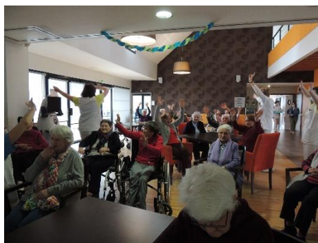
Reprise des activités, après-midi musicale.