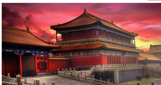
La cité interdite