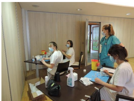
Journée vaccination, Les infirmières en pleine préparation.