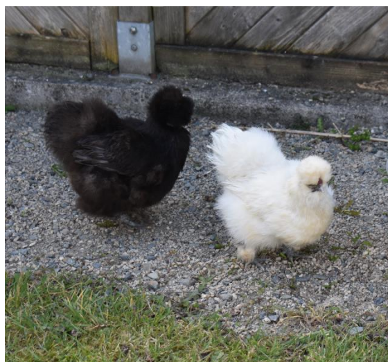
Les poules se baladent dans le jardin