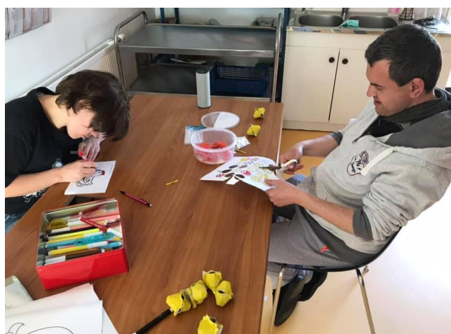
Préparation des décorations de pâques