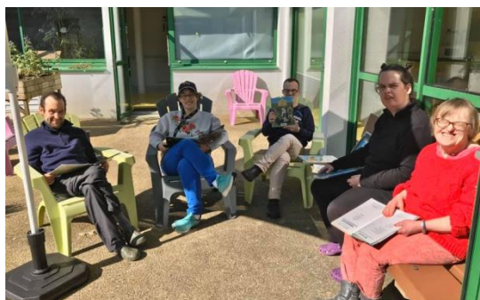
Lecture dans le patio du foyer