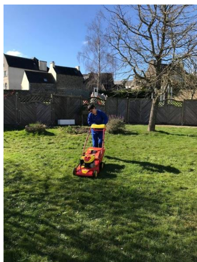
Première tonte de l'année pour Laëticia