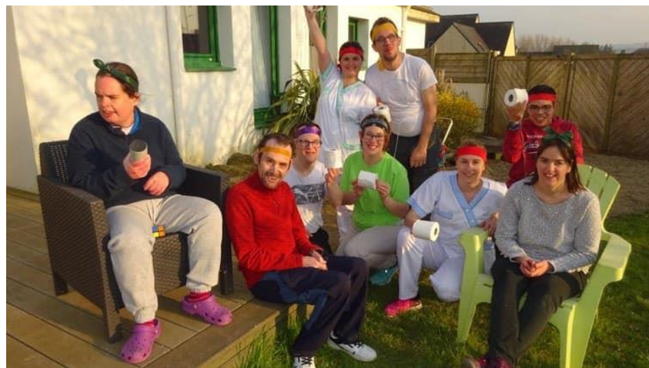
Défi : Jonglage avec du papier toilette