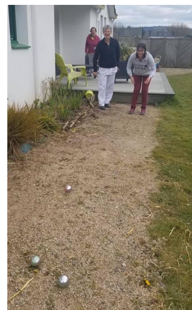
Une petite partie de pétanque dans le jardin